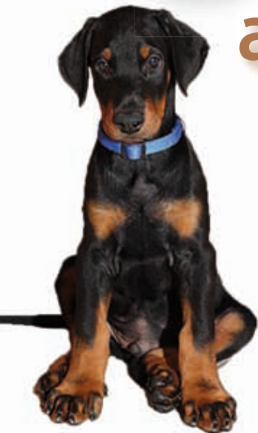
In alto: esemplare dell'allevamento Altengarde. Sotto: esemplare dell'allevamento Casa Giardino

Cinque domande a quattro allevatori di dobermann per capire in che direzione sta andando nel nostro Paese una razza che, seppur in sensibile calo numerico, si conferma al top della morfologia e stabilità di carattere. Sui prossimi numeri le risposte di altri allevatori.