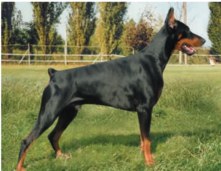
In alto: Soggetto dell'allevamento Villa Conte. Sotto un esemplare dell'allevamento Sauli Grimaldi impegnato in un salto durante una prova di obbedienza. Più in basso cuccioli dell'allevamento Carybdis