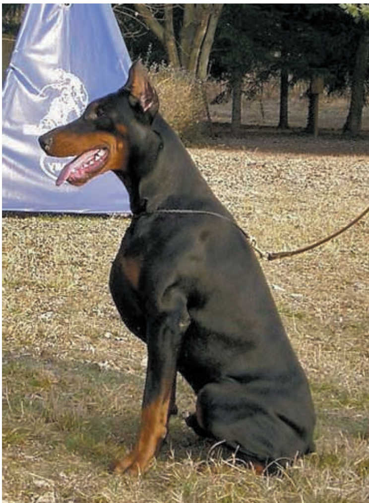
In alto: esemplare dell'allevamento Nobili Nati. Sotto: cuccioli dell'allevamento De Andreoli