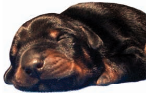
In alto: cucciolo di pochi giorni dell'allevamento Prisco. Sotto a sinistra testa dell'allevamento Sauli Grimaldi, in basso maschi di Stefusto e coppia dell'allevamento De Andreoli.