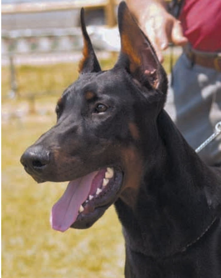
In alto: esemplare dell'allevamento Montaldo. Sotto a sinistra Goldeneye e Camilla dell'allevamento Nobili Nati e a destra un esemplare dell'allevamento Ardens